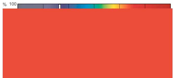
XDPB_XDMSR_SA-Spectral power distribution B/W