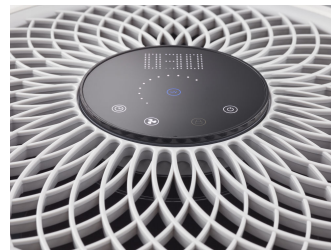
UVCA200 UV-C Floor standing air unit