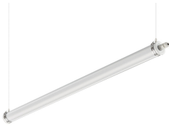
CoreLine tubular waterproof on a suspension wire