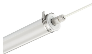
CoreLine tubular waterproof, easy connection