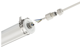
CoreLine tubular waterproof, installation