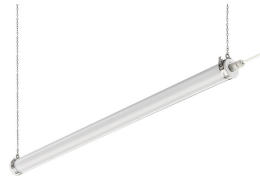
CoreLine tubular waterproof on a suspension chain