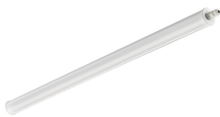
Standard product photo, CoreLine tubular waterproof PMMA, L1200